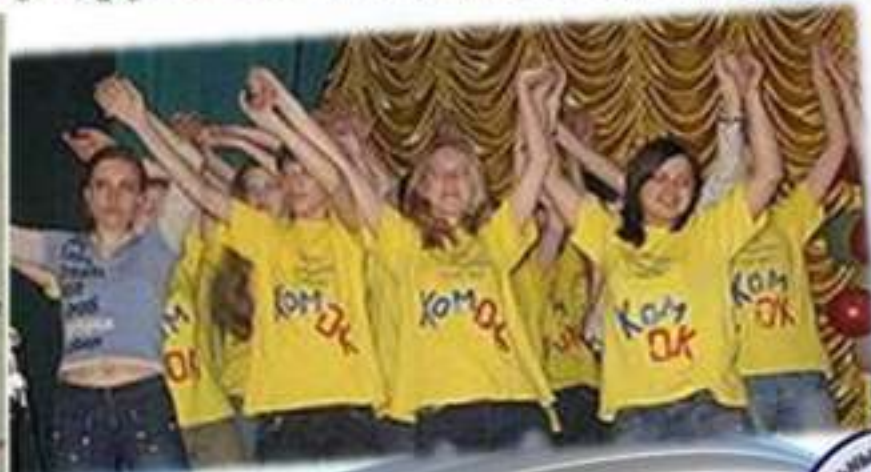
Команда КВН «Ком ОК»