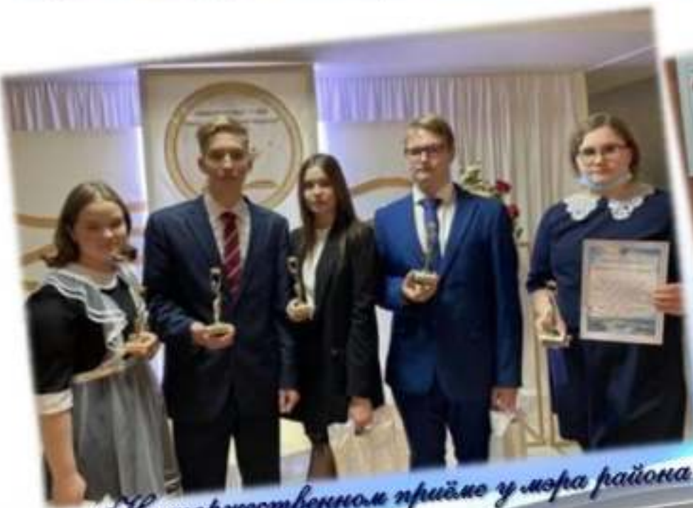
На торжественном приёме у мэра района