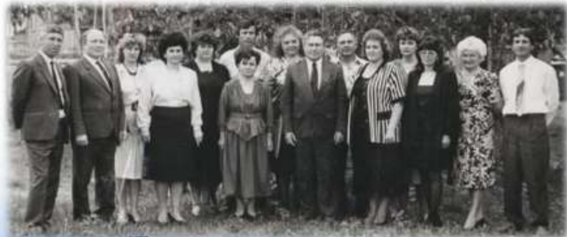
Педагоги профессионального училища