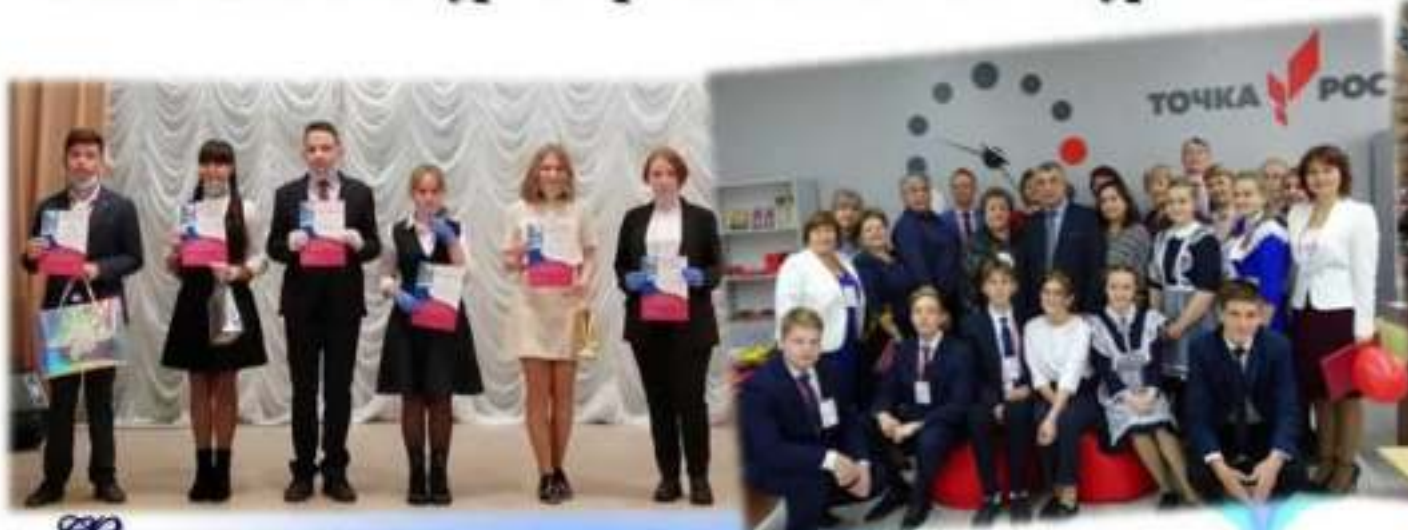
Победители районного конкурса «Ученик года – 2020»