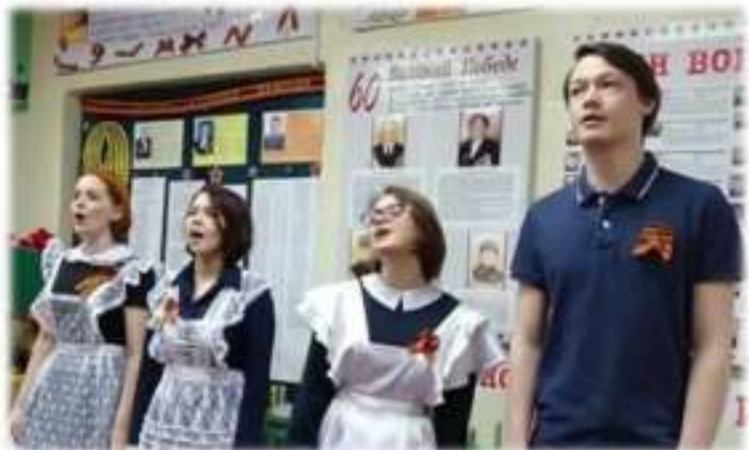
Вокальная группа «ОРУЖЬЕ»