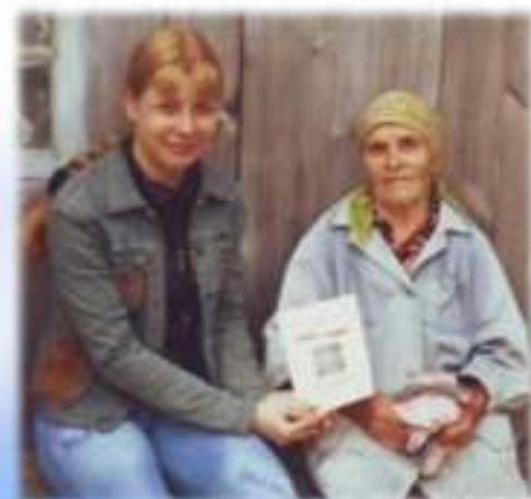
Вручение сборника воспоминаний «Память сердца»