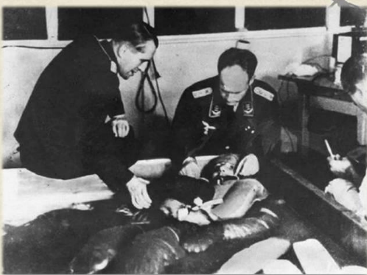
Заклученный концлагеря в ледяной воде. Опыт