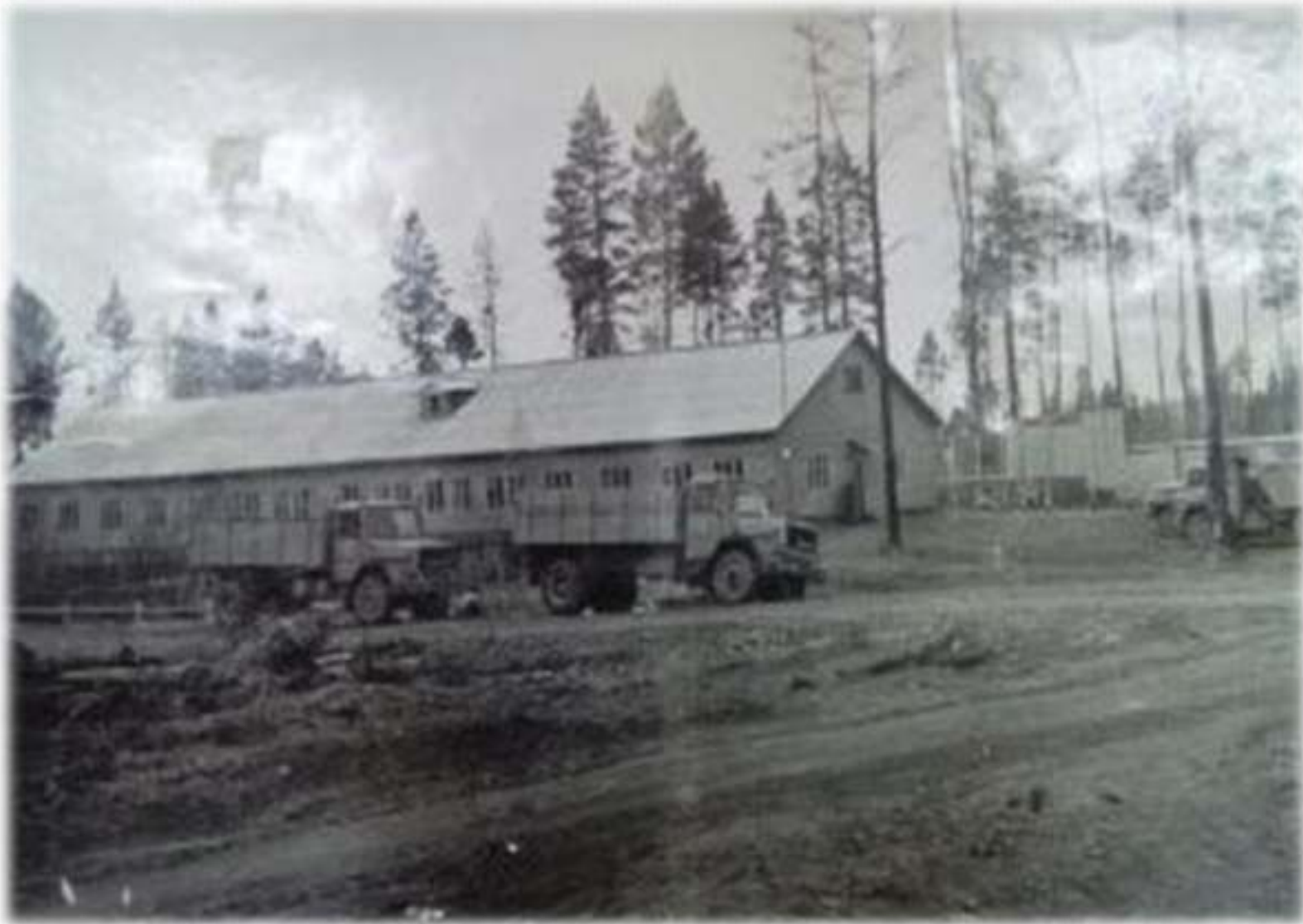
«Новый поселок, новая контора»