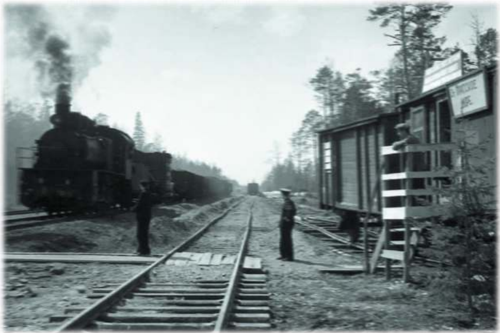
Электрификация линии Тайшет - Лена