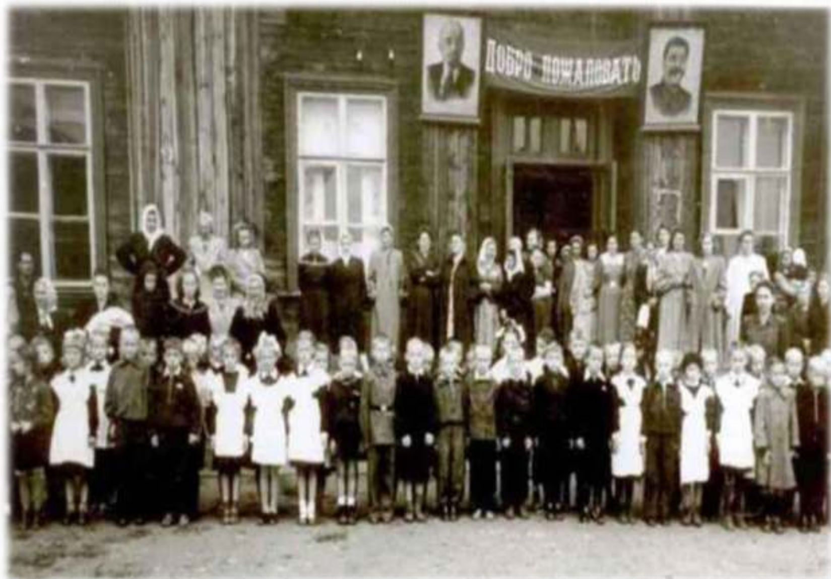
Больше-Мамырская средняя школа посёлка Заярск, 1953 год