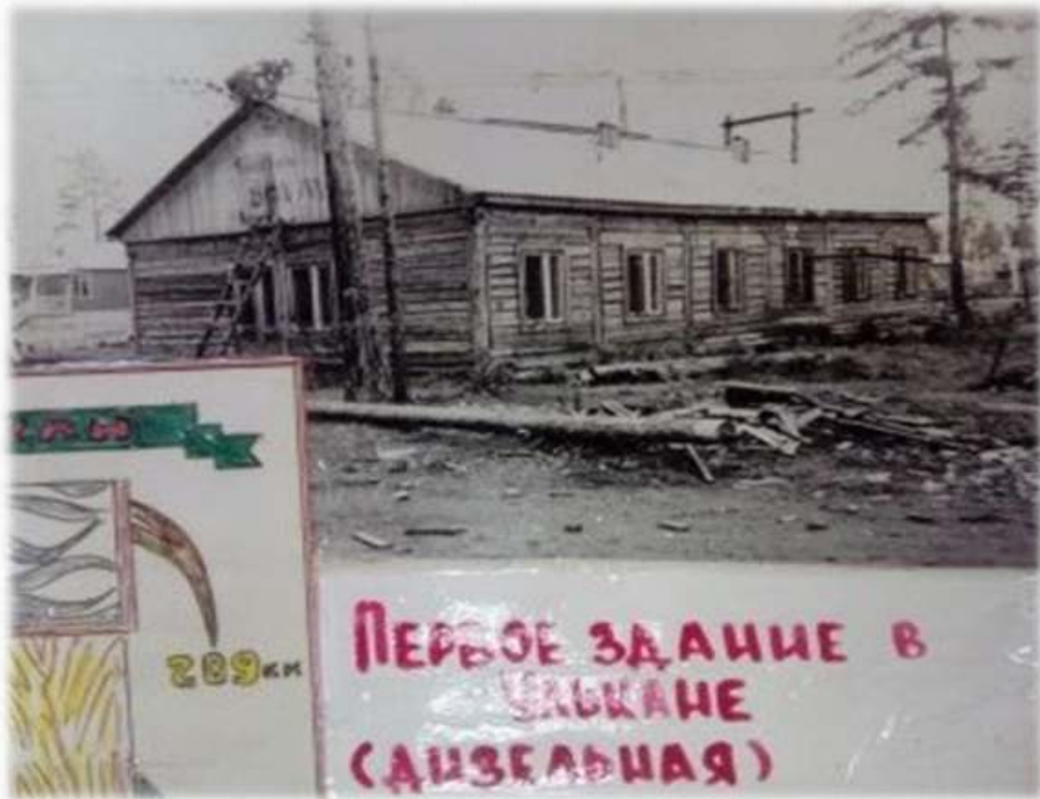
Страница из летописи Улькана