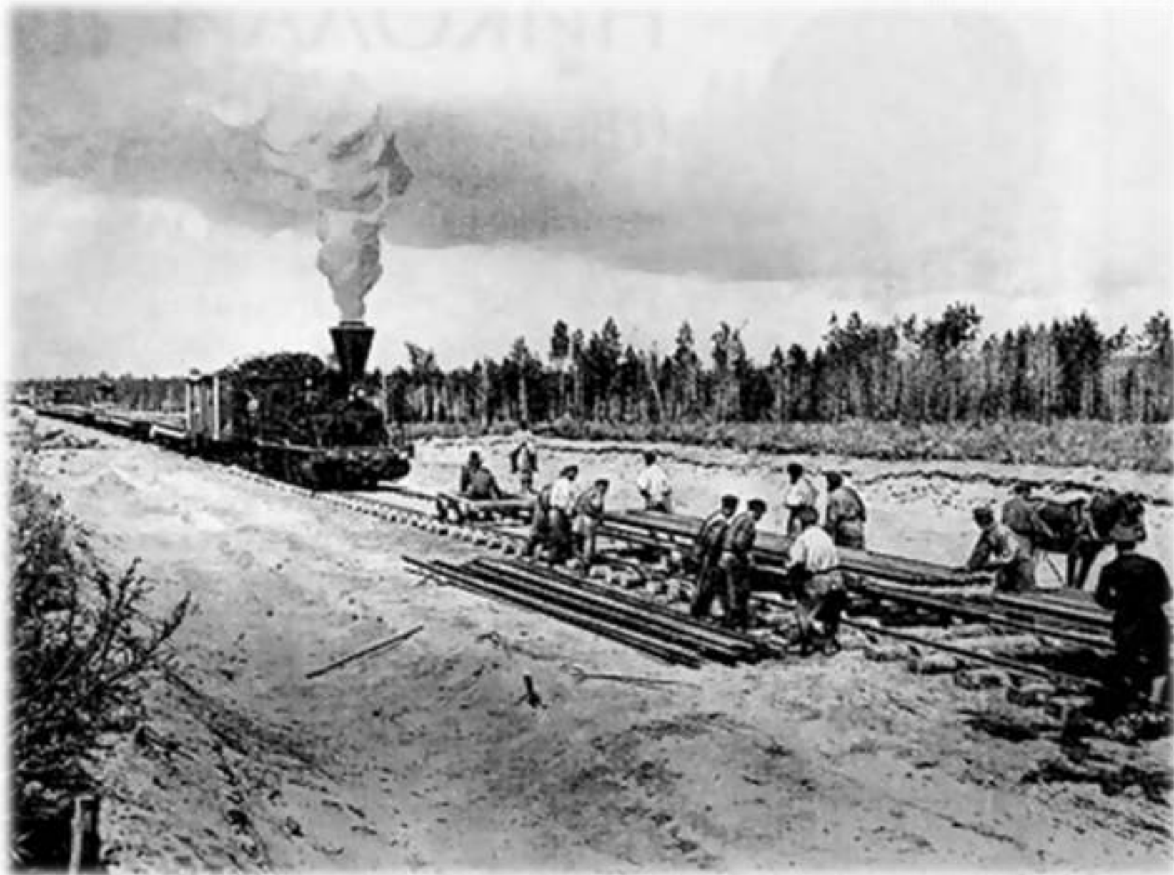
Разъезд «41-й километр» Транссиба