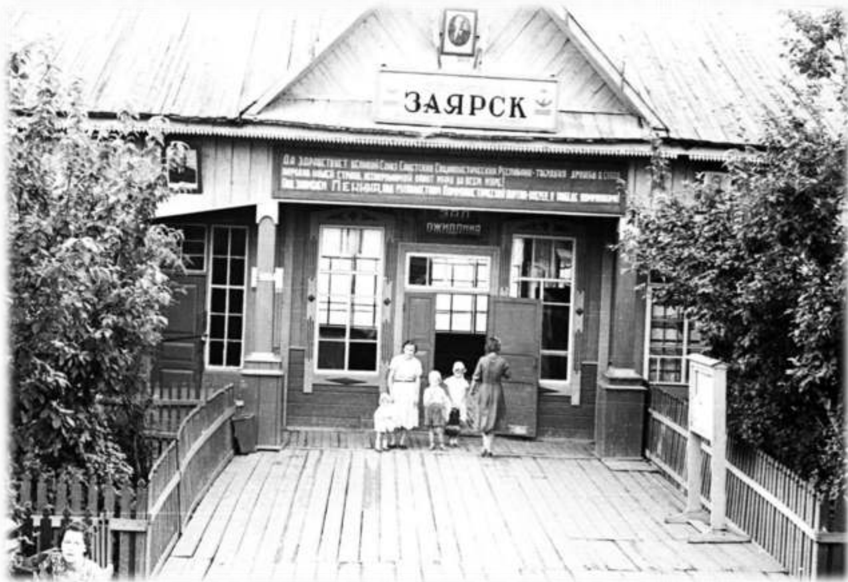
Поселок Заярск Иркутская область 1950-е года