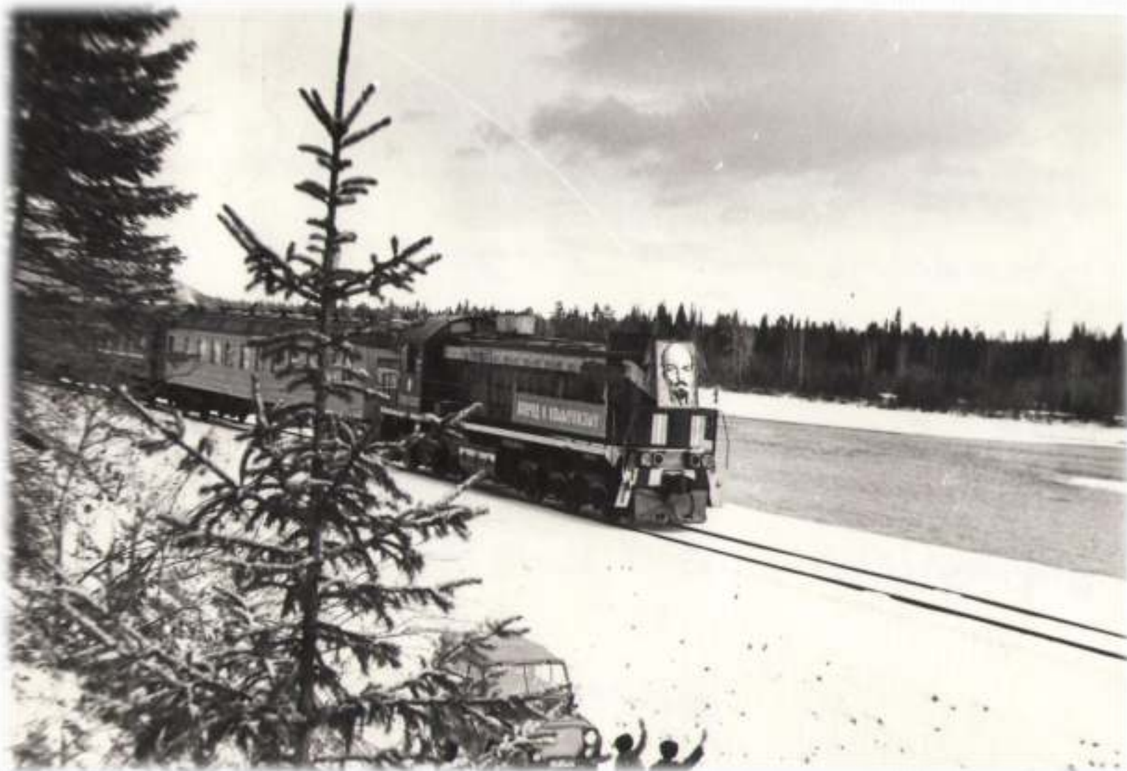
Первый поезд в поселке Улькан. 29 октября 1977 год