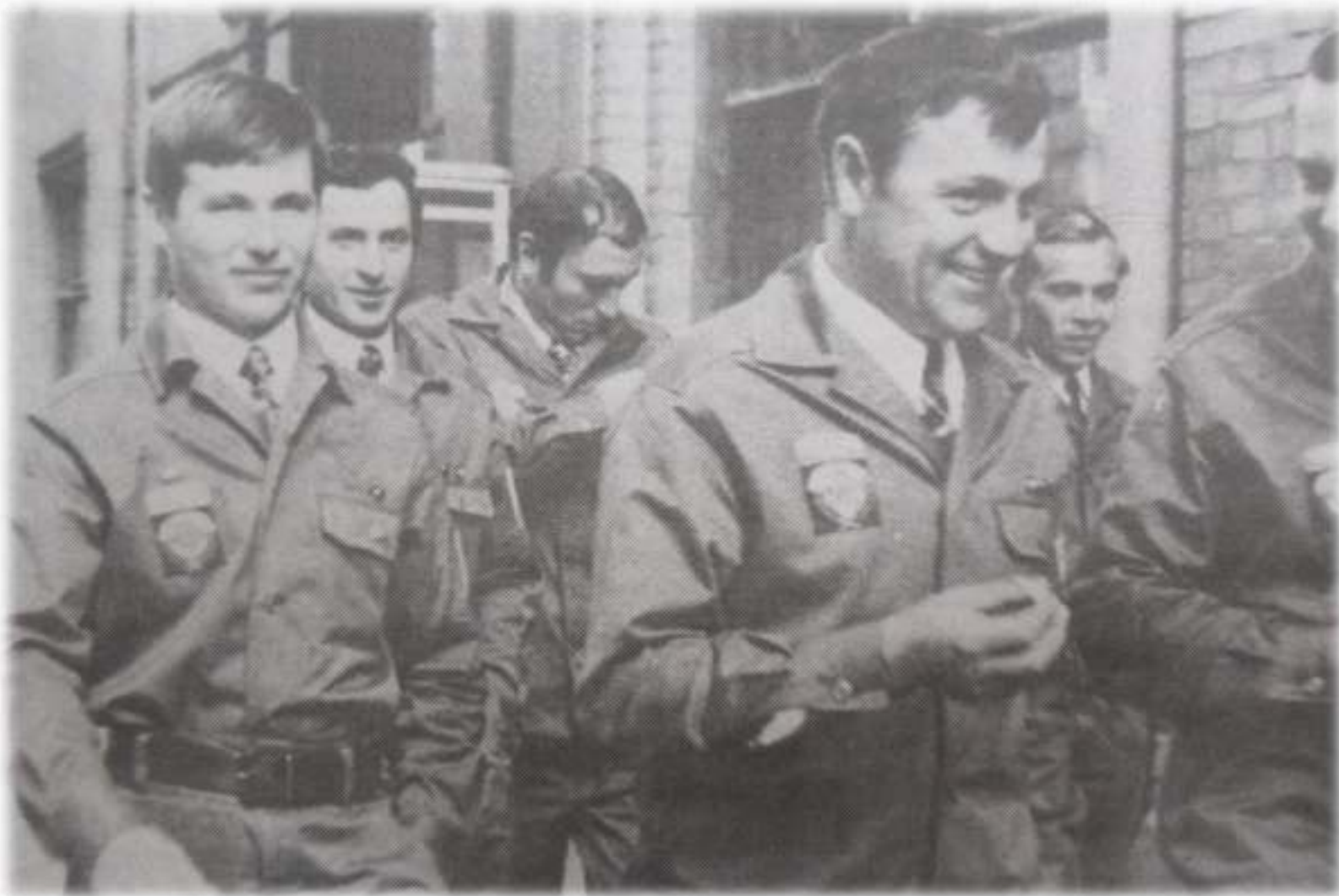
Советские строители в форме стройотряда, которую Чилийские фашисты, принимали за военную. 1973 год