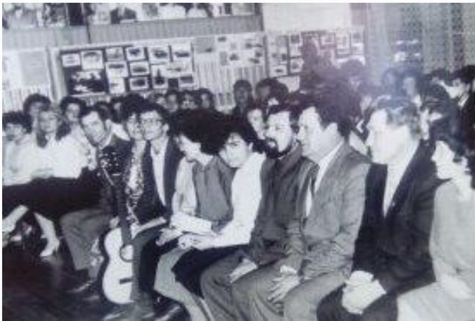
Торжественное собрание, посвященное 15-летию поселка Ульянов