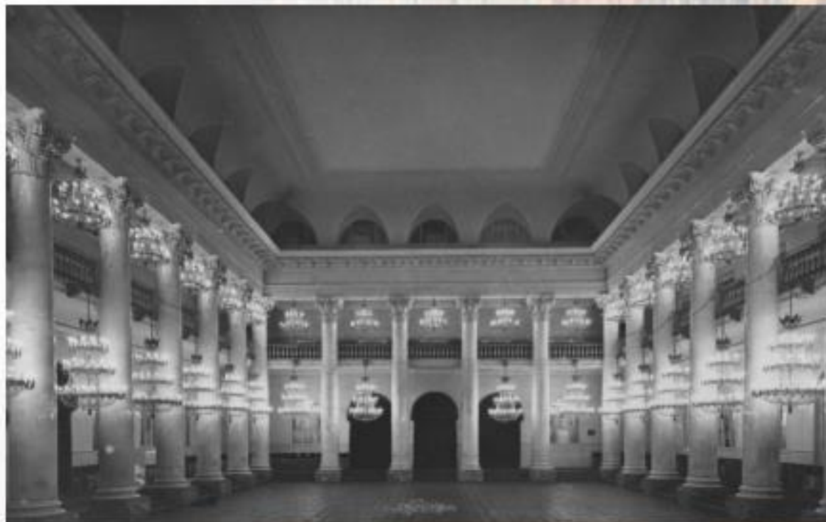
Колонный зал Дома Союзов г. Москва

26 МАРТА 1943 года – первое проведение праздника детской книги «Книжкины именины»