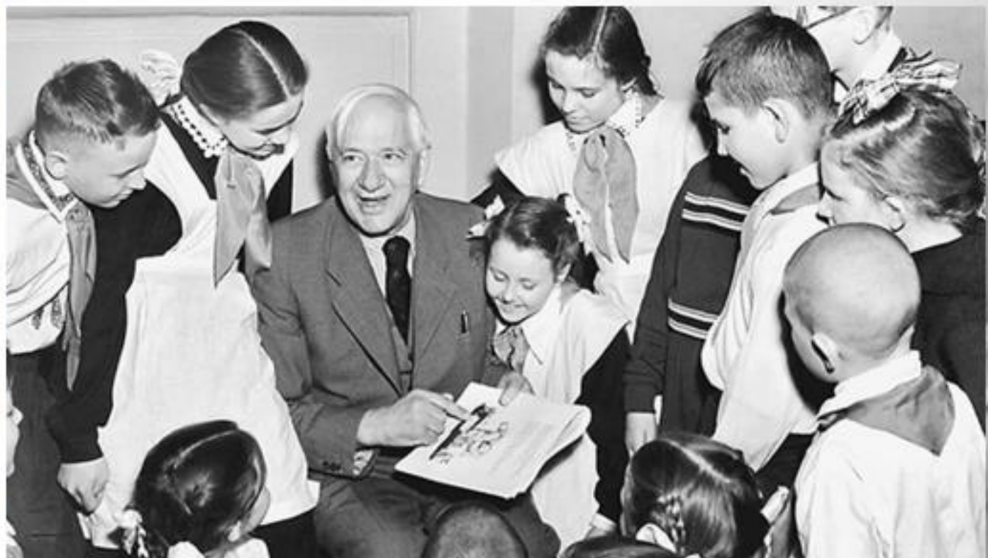
Корней Чуковский с детьми