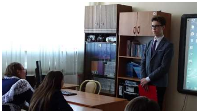
На снимках И. Сотниковой запечатлены моменты защиты портфолио

Портфолио после защиты были выставлены в фойе. Их можно было полистать, рассмотреть, будущим девятиклассникам взять на вооружение идеи по оформлению. К слову, восьмиклассники всегда